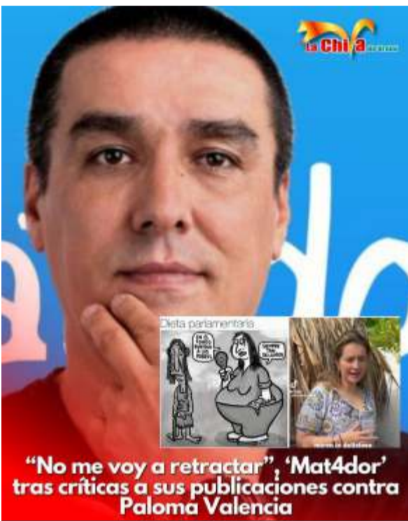
"No me voy a retractar", 'Mat4dor' tras críticas a sus publicaciones contra Paloma Valencia