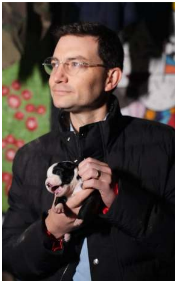
El candidato a la presidencia de Colombia, Felipe Córdoba Larrarte, luego de su presentación de 20 minutos en Caracol TV en su famoso programa Elecciones presidenciales. Fue éxito total. Puede ser? Usted decide.