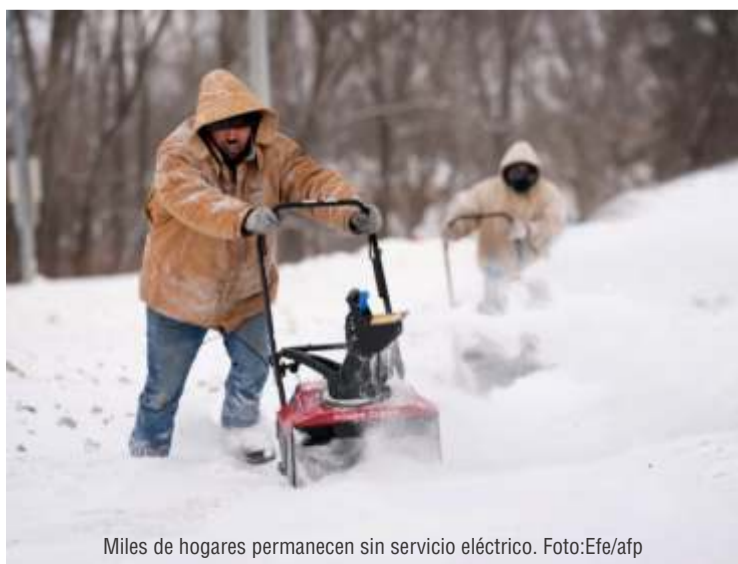
Miles de hogares permanecen sin servicio eléctrico.