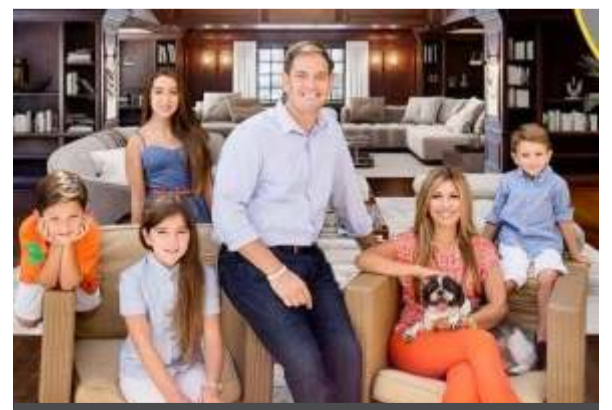
Marcos Rubio el hombre más poderoso de los Estados Unidos, en la grafica con su bella esposa de Pereira, obviamente colombiana y sus pequeños hijos.