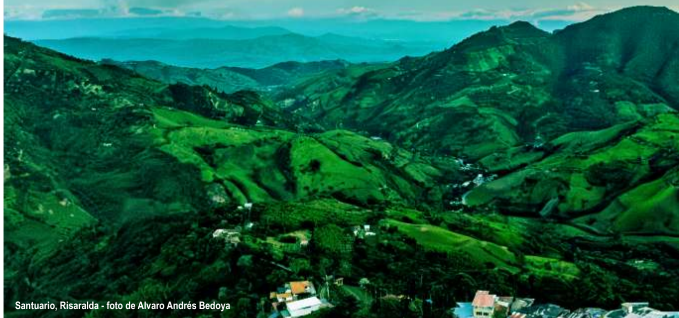
Santuario, Risaralda

Joven en su implícito deseo de avanzar por el mismo camino y dichoso lugar de grandeza que hasta hoy a recorrido.