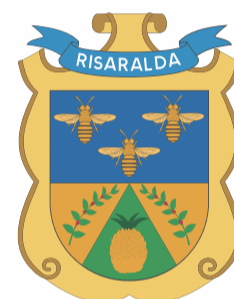
DEPARTAMENTO DE RISARALDA